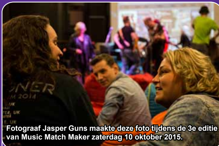
Fotograaf Jasper Guns maakte deze foto tijdens de 3e editie van Music Match Maker zaterdag 10 oktober 2015.

Tijdens deze middag, georganiseerd door samenwerkingsverband Muziekkompas, zijn er weer meerdere matches gemaakt tussen bands en muzikanten!