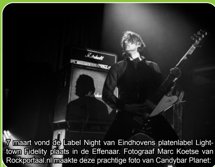
7 maart vond de Label Night van Eindhoven's platenlabel Lighttown Fidelity plaats in de Effenaar. Fotograaf Marc Koetse van Rockportaal.nl maakte deze prachtige foto van Candybar Planet:

"Gitaar riffs met een hoog 'surf-gehalte'. Dit levert een heerlijke pot rock op en daarmee een waardige afsluiter van de avond."