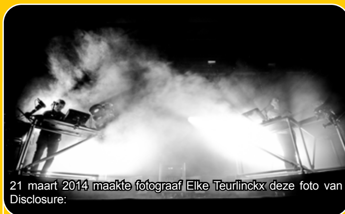
21 maart 2014 maakte fotograaf Elke Teurlinckx deze foto van Disclosure:

"Op de foto zie je de Engelse jonge broertjes 'Lawrence' die op dat moment spelen voor een uitverkochte show in het Klokgebouw. Alle nummers werden zelf gespeeld door de mannen."