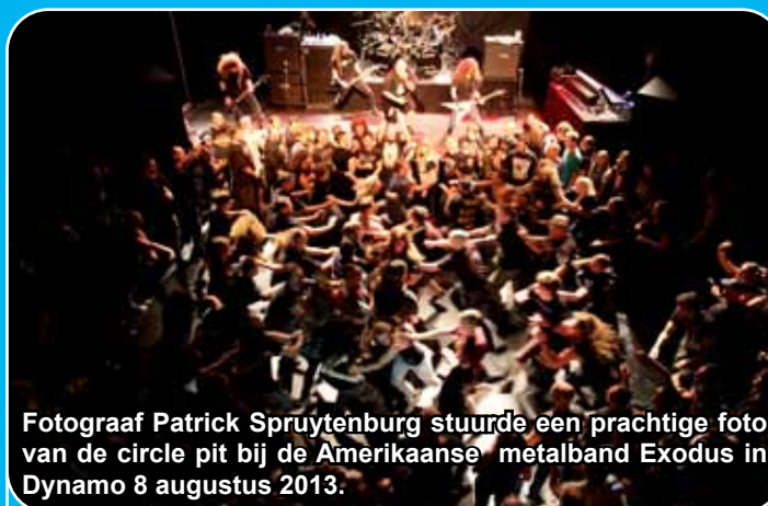
Fotograaf Patrick Spruytenburg stuurde een prachtige foto van de circle pit bij de Amerikaanse metalband Exodus in Dynamo 8 augustus 2013.

"Opener The ballad of Leonard and Charles van hun laatste album wordt ingezet, de zanger laat z'n vinger een paar keer rond-draaien en voilà: de eerste circle pit is er!", aldus Patrick. Lees het hele artikel op: www.rockportaal.nl/exodus-dynamo-eindhoven-08082013/ Inzendingen voor de lezersrubriek kunnen worden gestuurd naar mirjam@popei.nl .